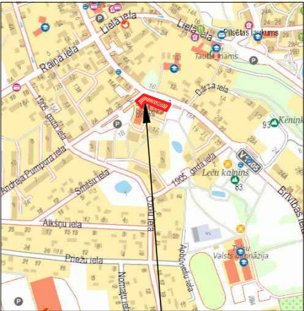
OBJEKTA ATRĀŠANĀS VIETAS SHĒMA